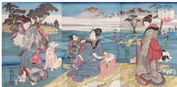
歌川国芳 摂津国播磨の玉川<三枚続> Utagawa Kuniyoshi / The Toi Tamagawa-river in Settsu Province <A triptych>