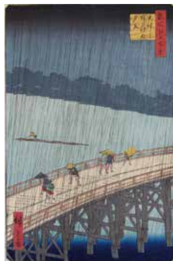
歌川広重「大はしあたけの夕立」 Utagawa Hiroshige / Sudden Shower Over Ohashi Bridge and Atake

The exhibition, "Hokusai and Hiroshige, Loved by the great artists," will feature over 60 Ukiyo-e woodblock prints, mainly works by Katsushika Hokusai and Utagawa Hiroshige, who made an impact on the world. Popular painters created imaginative Ukiyo-e prints, which were loved by artists around the world. Such Ukiyo-e prints were created with the high skill of craftsmen in carving and printing. Enjoy such Ukiyo-e up close and personal to your heart's content.