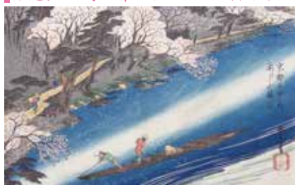
歌川広重 京都名所之内 あらし山満花 Utagawa Hiroshige / Cherry trees in full bloom at Arashiyama