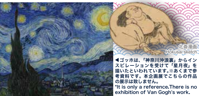
北斎漫画 Hokusai sketch

◀ゴッホは、「神奈川沖浪裏」からインスピレーションを受けて「星月夜」を描いたといわれています。※あくまで参考資料です。本企画展でこちらの作品の展示は致しません。 *It is only a reference. There is no exhibition of Van Gogh's work.