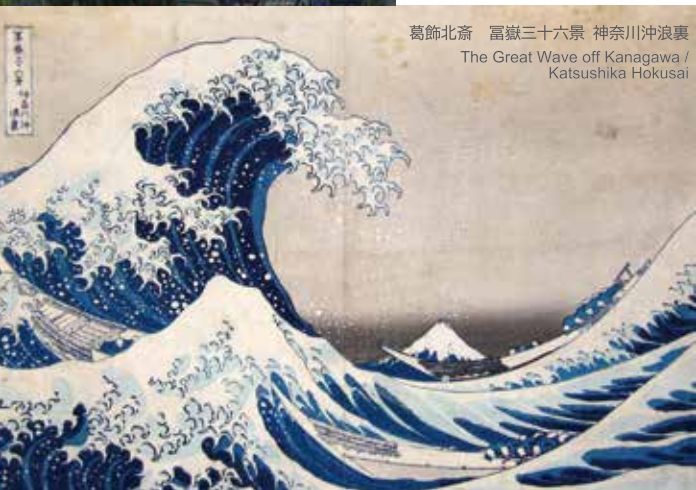
葛飾北斎 富嶽三十六景 神奈川沖浪裏 The Great Wave off Kanagawa / Katsushika Hokusai

◀ゴッホは、「神奈川沖浪裏」からインスピレーションを受けて「星月夜」を描いたといわれています。※あくまで参考資料です。本企画展でこちらの作品の展示は致しません。 *It is only a reference. There is no exhibition of Van Gogh's work.