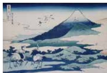
葛飾北斎「相州梅澤左」 Katsushika Hokusai / Soshu Umezawa Hidari